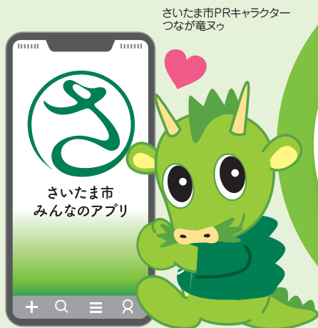
さいたま市PRキャラクター つなが電メ